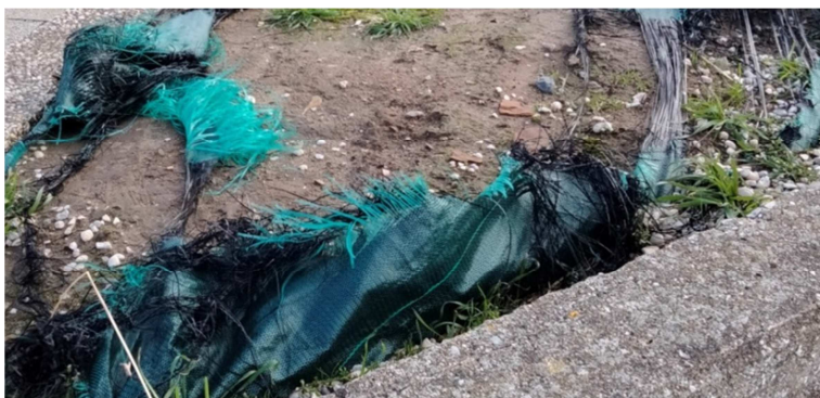
L'utilisation de couvert plastique n'a rien de durable

L'utilisation de couvert plastique est à proscrire. Il est aujourd'hui bien démontré que ces bâches libèrent des particules de plastique dans le sol et dans les eaux pluviales. Elles sont aussi une nuisance empêchant l'avifaune (dont protégée) de se nourrir au sol et constituent un obstacle aux rentrées et sorties de l'entomofaune pendant leur différentes phases de leur développement. Ces couverts limitent l'infiltration des eaux dans les sols et accélèrent les écoulements des eaux, accélérant l'érosion des sols, augmentant le taux de particules dans les eaux pluviales. En aucun cas ce type de revêtement ne doit être à nouveau installé, il faut privilégier un paillage si l'on recherche un substitut. A ce titre l'utilisation des produits de tonte de gazon a tout aussi le même effet tout en permettant un débouché pour ces produits.